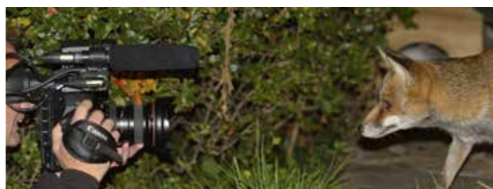
En of de dieren schuw waren? "Nee, ze kwamen zelfs aan de camera snuffelen."

In zijn film gaat de cineast op zoek naar de momenten waarop het gedrag van wilde dieren dat van mensen beïnvloedt, wanneer er bepaalde spanningen ontstaan tussen de twee levenssferen waarvan we dachten dat ze definitief van elkaar gescheiden waren. Hij ging aanvankelijk uit