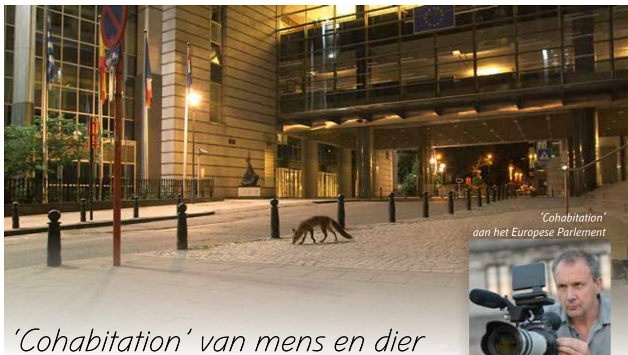
'Cohabitation' aan het Europese Parlement